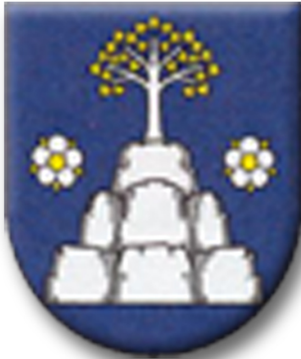
príloha č. 1